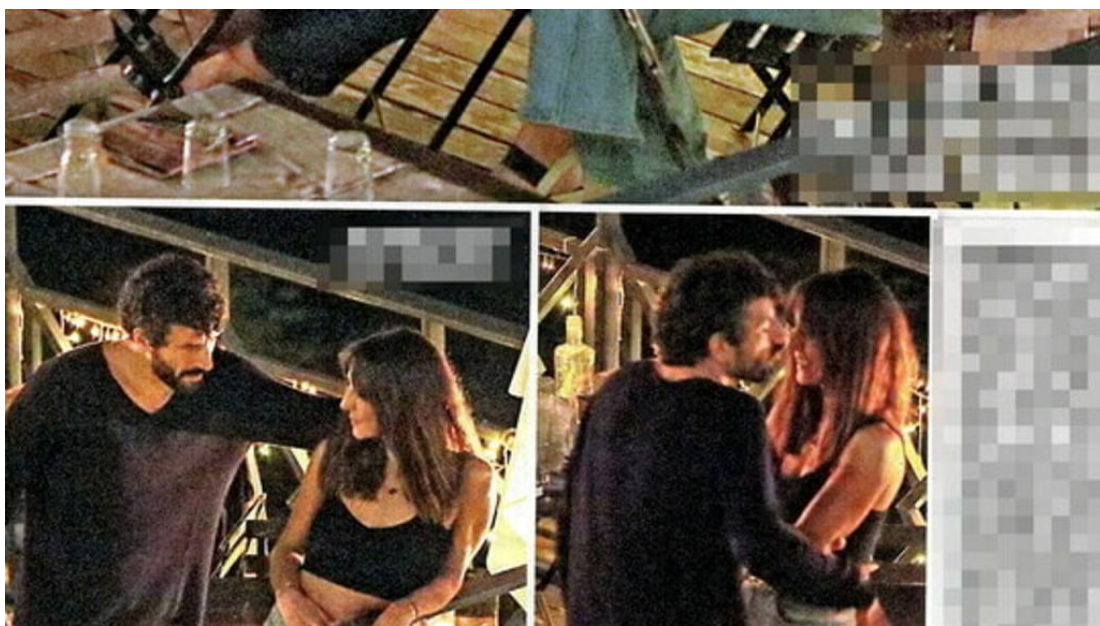
Ambra Angiolini e Francesco Scianna su "Diva e Donna"

"L'unico vero fallimento che riconosco è la fine del rapporto con Francesco" – ha detto l'attrice a Vanity Fair . "Dopo la rottura della mia famiglia sono caduta in depressione, finita nella fogna delle fogne, ed era giusto che ci finissi, perché era il passaggio dell'elaborazione di un lutto enorme".