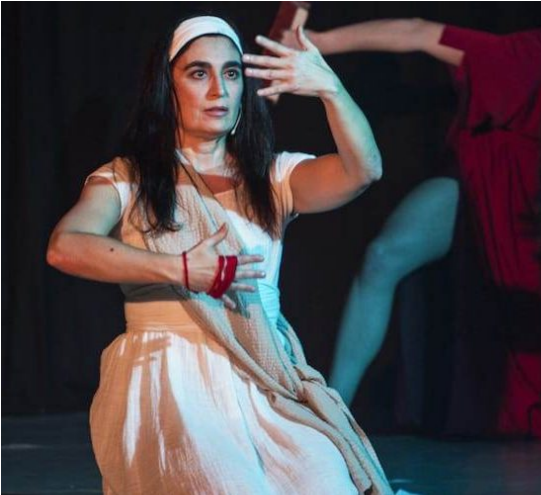
Segesta Teatro Festival