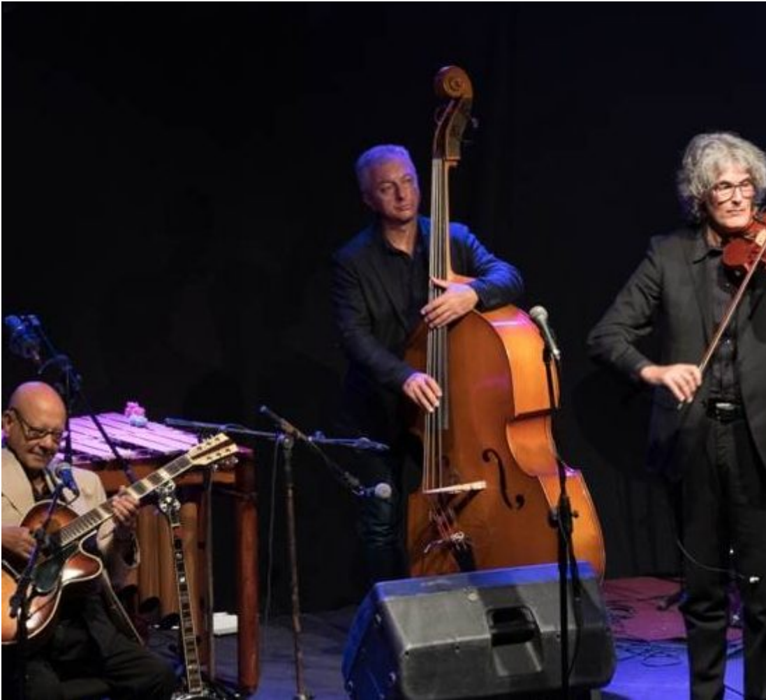
Segesta Teatro Festival