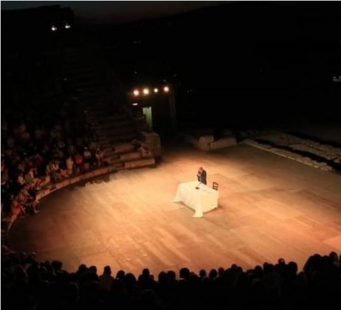
Segesta Teatro Festival

Tempio , che ospiteranno le creazioni di una molteplicità di artisti di rilevanza nazionale e internazionale, pronti a condividere il loro sguardo con il pubblico del festival, a farsi comunità.