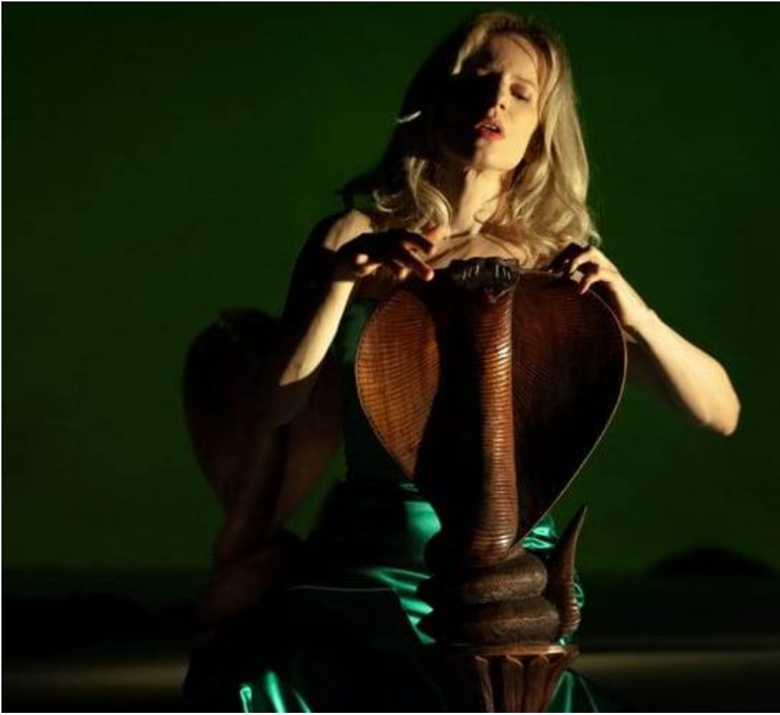
Segesta Teatro Festival