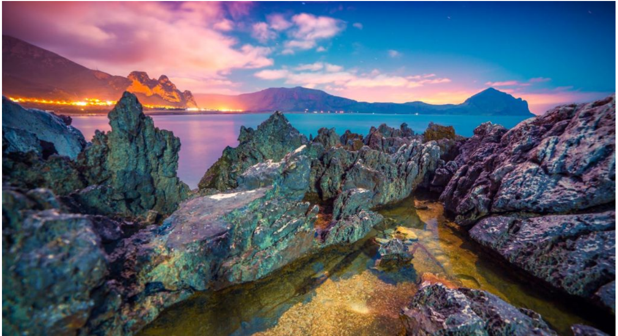
Golfo di Makari

Il Golfo di Macari è a forma di mezzaluna: una terra apparentemente aspra, per via delle tante rocce, che tuttavia svela straordinarie calette e scogliere a strapiombo, rocce accarezzate dalle onde, ideali per stendersi al sole. E, a proposito di sole, è qui che il tramonto è un incanto. Nelle giornate più limpide, dal golfo si vedono i profili delle Egadi e basta percorrere la costa per fare il pieno di meraviglie. Ci si può tuffare nella caletta del Bue Marino , nella celebre spiaggia di Santa Margherita e godere dello scenario al calar del sole, con un panorama dominato dal Monte Cofano , parte dell'omonimo Riserva Naturale Orientata.