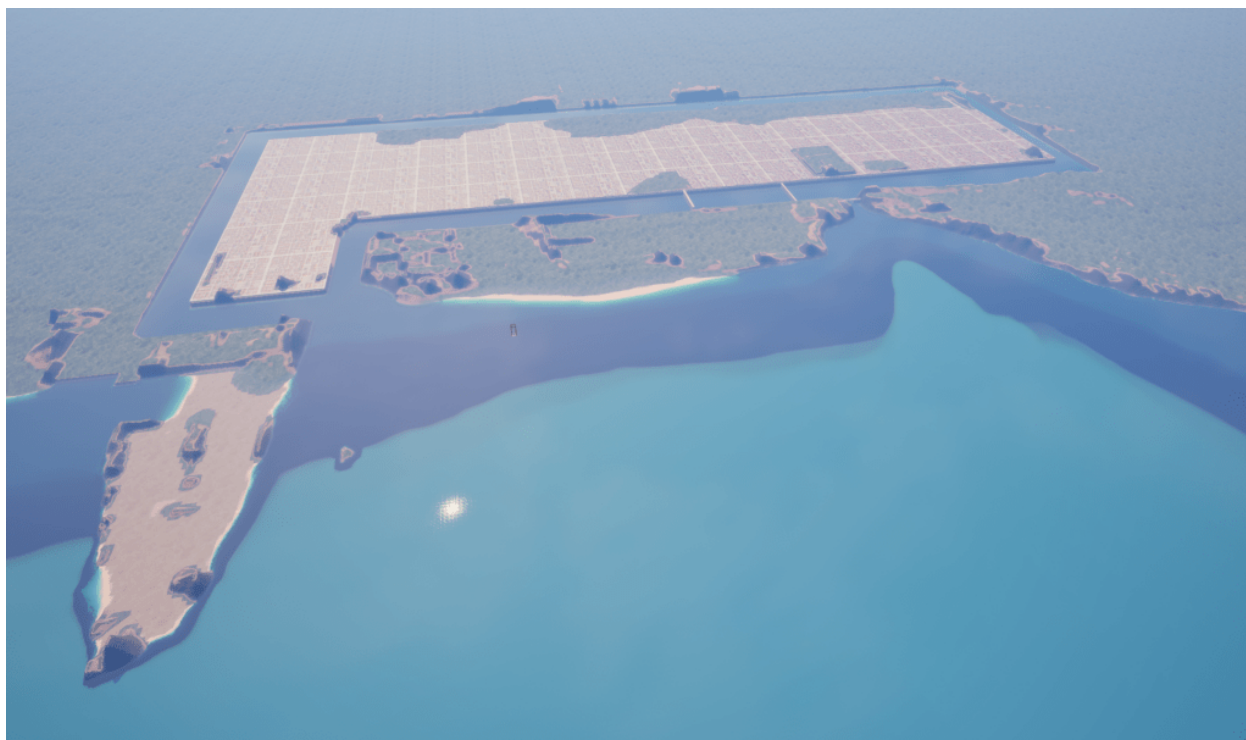
Visualizzazione di Telepylos circa 9.600 a.C.

“Telepylos – scrive Chaissons – si distingue non solo per la sua scoperta, ma anche per gli enigmi che pone . Come poteva un insediamento così esteso esistere in questo luogo, ora perduto sotto il mare? Quando ha incontrato la sua fine e quali forze hanno cospirato per seppellirlo nelle profondità del Mediterraneo?”.