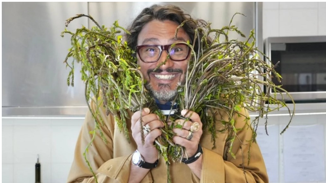
Alessandro Borghese sull'Etna

Chef Borghese esplora un territorio dominato dal vulcano, che con la sua forza plasma paesaggi e tradizioni gastronomiche. Un contesto dove la cucina diventa espressione diretta del suolo, della stagionalità e del lavoro quotidiano dei ristoratori.